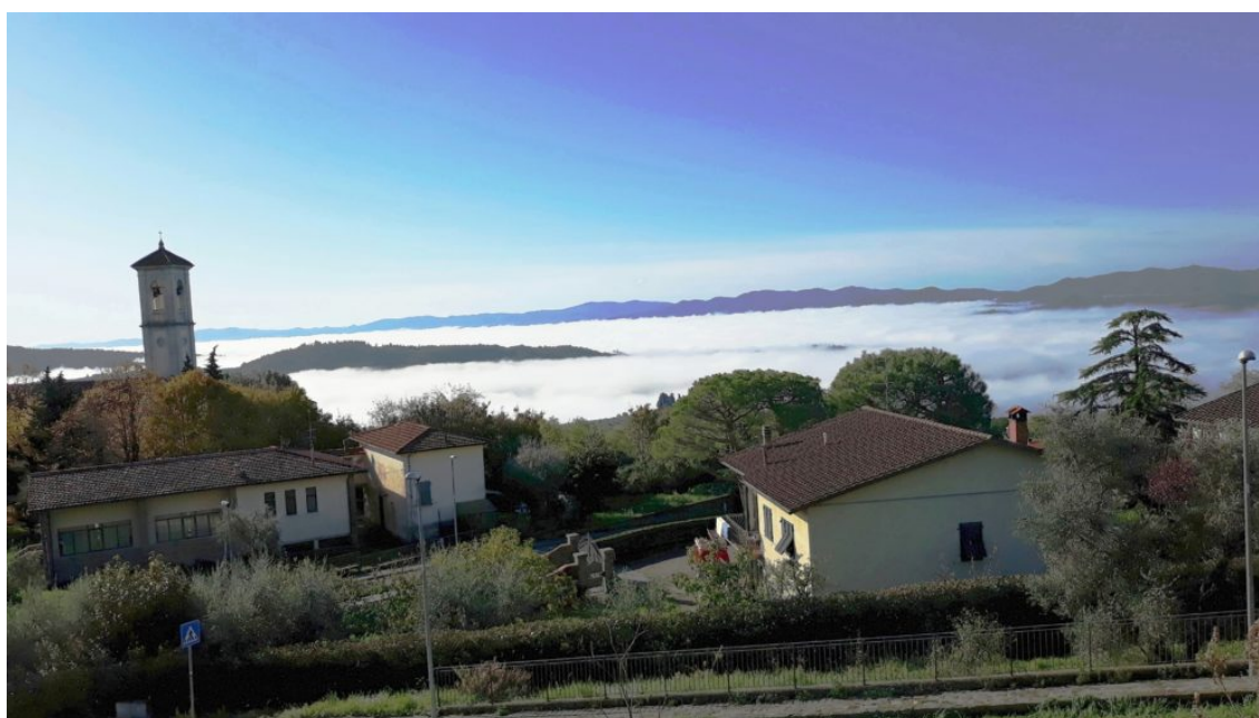
Nebbia sul Valdarno dal posteggio di Diacceto il 10 novembre 2019