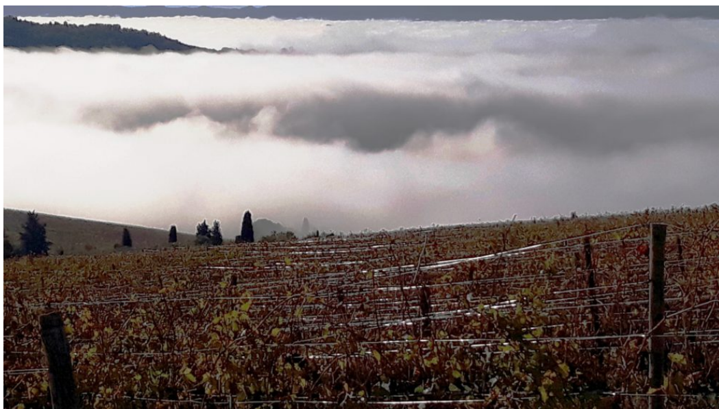
Nebbia sul Valdarno dai vigneti il 10 novembre 2019

E' molto difficile immaginare come poteva qui essere il territorio al tempo della foresta. La mano dell'uomo qui non è stata leggera; necessità e compensi l'hanno mossa sottomettendo l'ambiente per questi scopi.